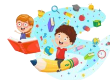
«Учимся быть грамотными»