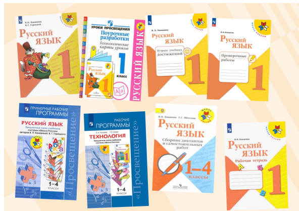
Программа «Школа России»