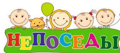
Группа продленного дня «Непоседы»